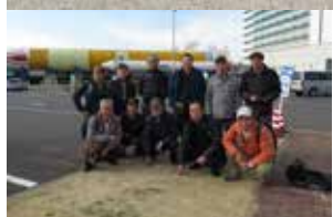
↑平成28年・筑波宇宙センター