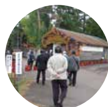
第7回 故郷訪問・金升酒造見学