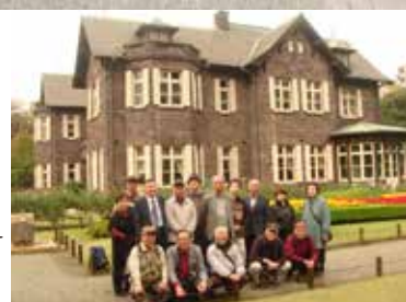
→平成27年・旧古河庭園見学