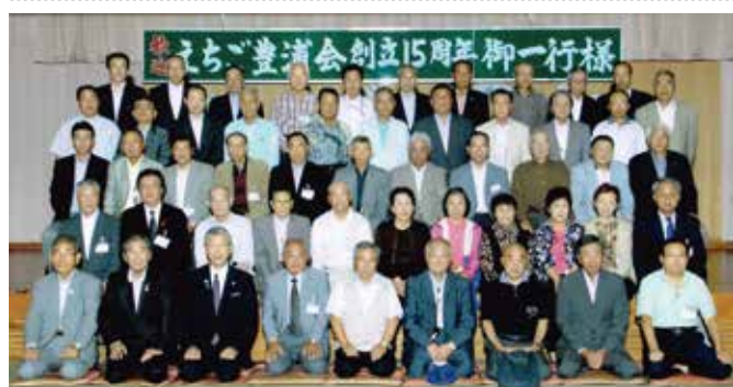
平成25年・第6回ふるさと訪問 「ホテル摩周」

最大の目的は、地元賛助会の皆様との懇親会です。毎回月岡温泉のホテルで、市、町の役職の方々の来賓参加を頂き、50名を超える盛大な懇親会です。